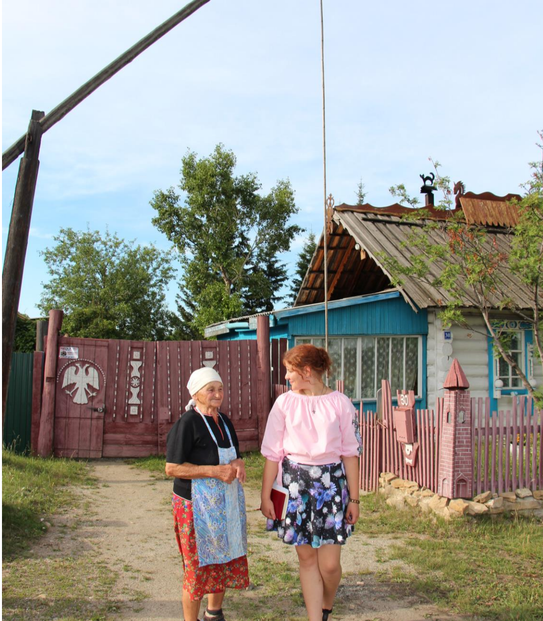
ПРОГУЛКИ ПО СЕЛУ