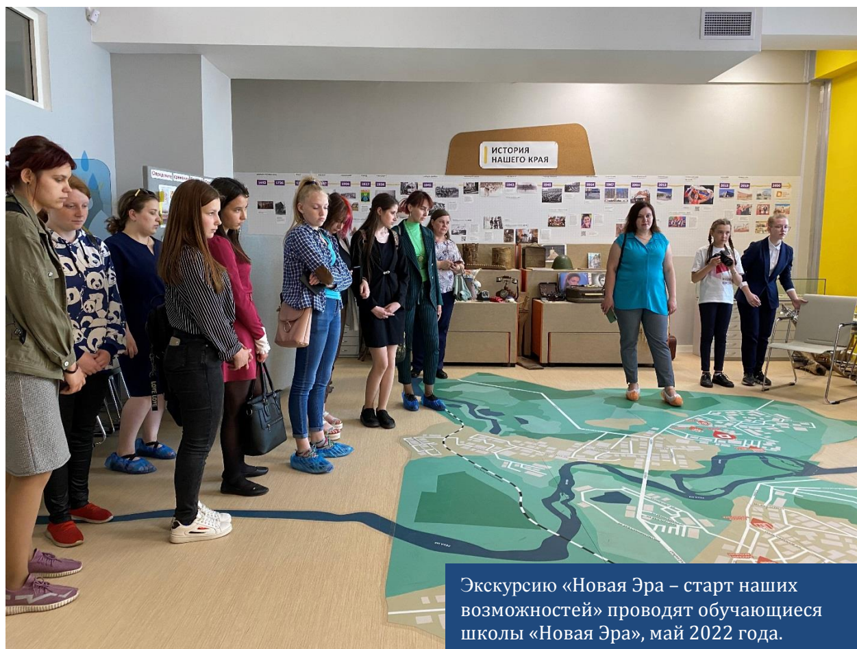
Экскурсию «Новая Эра – старт наших возможностей» проводят обучающиеся школы «Новая Эра», май 2022 года.