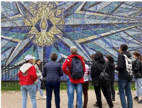
Команда медицинского колледжа проводит экскурсию «Есть такой посёлок в центре Тулуна», май 2022 года

Члены экспертного совета оценивали прогулки по нескольким критериям: продуманная логика построения прогулки, оригинальность замысла, эмоции и польза, полученные во время экскурсии, ее безопасность. Итоги конкурса были объявлены 1 июня 2022 года.