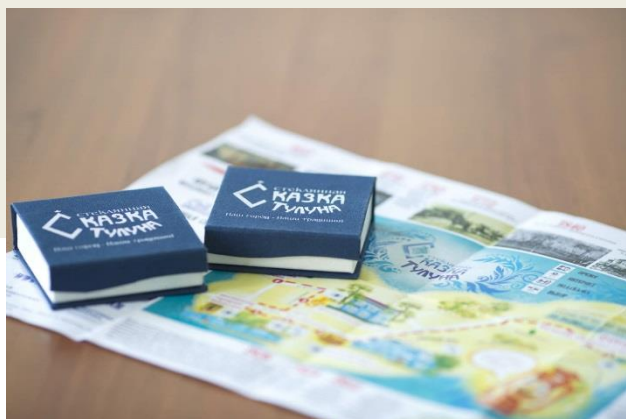
2018 год. Квест – игра «Стеклянная сказка Тулуна»